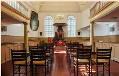
LUTHERSE KERK LEEUWARDEN

FRIESLAND. Op 15 januari was er een gemeentevergadering in de lutherse kerk te Leeuwarden. Ook hier wordt de last door steeds minder zielen gedragen. Men gaat de Classis vragen om een 'kleine gemeente' te worden. Daarvoor zijn geen zes, maar drie kerkenraadsleden nodig. Ook kunnen zo diaconie en kerkenraad op financieel gebied worden samengevoegd. Een aantal oudgedienden zwaait binnenkort af en er is nog geen zicht op vervanging. Ook al het niet bestuurlijke vrijwilligerswerk wordt door een handjevol mensen gedaan, waarvoor hulde, maar dit betekent ook dat bijvoorbeeld de tweejaarlijkse bloemendienst niet meer in gebruikelijke vorm kan worden voortgezet. De schoonmaak na verhuur zal wellicht worden uitbesteed en de energiekosten stijgen enorm. Het ontbreekt - zoveel is duidelijk - aan nieuwe en jonge aanwas. Vormen van samenwerking met noordelijke lutherse gemeenten worden onderzocht.