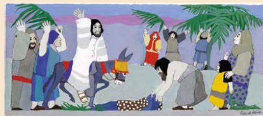
KEES DE KORT

KEES DE KORT. Wie van mijn generatie is niet groot geworden met de boekjes van Kees de Kort. Daarom wijs ik u graag op de tentoonstelling 'Kees de Kort. Ikonen: Christelijke feestdagen in beeld', tot en met 29 mei in het Stadhuis van Zierikzee. Misschien leuk in combinatie met een bezoek aan de kerkdienst in de Lutherse kerk aldaar. (Let op: in Zierikzee is om de week dienst, dus informeer even van tevoren).